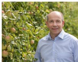
Lob von höchster Stelle für Florianer Direktvermarkter-Initiative 1. November 2019